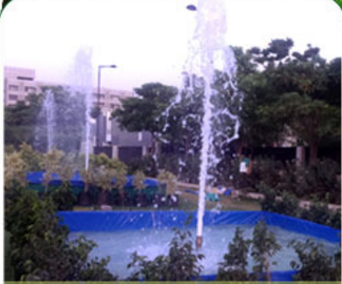
Water Fountains on Rent

Landscaping | Plant, Lawn, Water Fountains on Rent | Garden Development | Wall Garden | Irrigation Consultancy & Installation | All Types of Plants All over Maharashtra & Goa Service