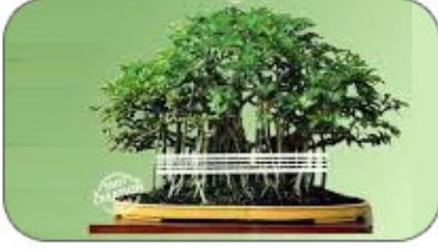
8 जुन वटपौर्णिमा जेष्ठ शुद्ध पौर्णिमा