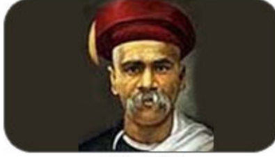
17 जुन गोपाल गणेश आगरकर पुण्यतिथी 14 जुलै 1856 - 17 जुन