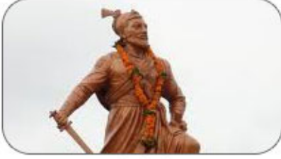
6 जुन छ. संभाजी महाराज जयंती जेष्ठ शुद्ध द्वादशी