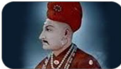
23 जुन नानासाहेब पेशवे पुण्यतिथी 16 डिसेंबर 1721 - 23 जुन