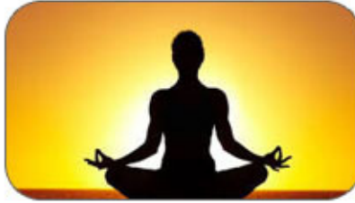
21 जुन जागतीक योग दिवस