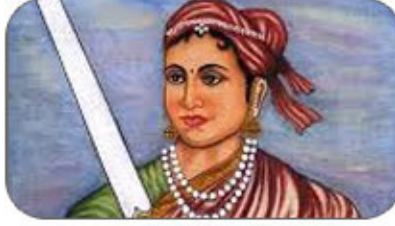
18 जुन झाशीची महाराणी लक्ष्मीबाई पुण्यतिथी