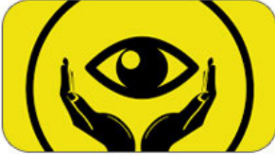
10 जुन जागतीक दृष्टीदान दिन