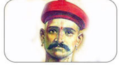
25 जुन दामोदर चाफेकर जयंती 25 जुन 1869 - 18 एप्रिल