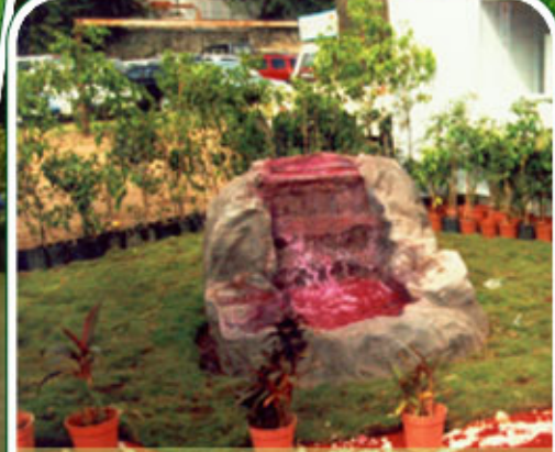
Plants & Lawn on Rent