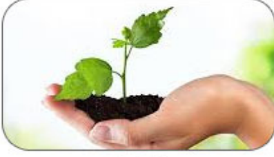
5 जुन जागतीक पर्यावरण दिन